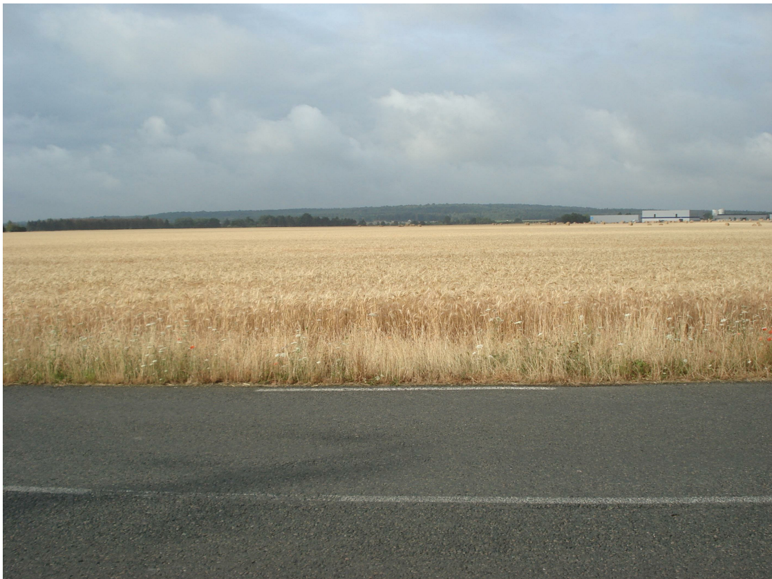
2 - Vue du terrain dans son état actuel depuis l'avenue du Parc Alata au Nord-Est de la parcelle, en direction du Sud-Ouest.

DEMANDEUR : 64, av. du Maréchal Joffre 60500 Chantilly GAMMALOG