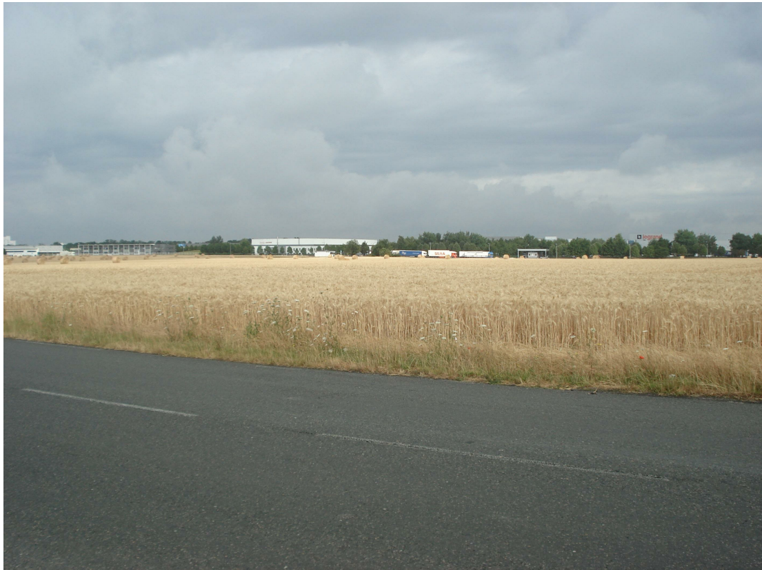
3 - Vue du terrain dans son état actuel depuis l'avenue de la Forêt d'Halatte au Sud-Est de la parcelle, en direction du Nord-Ouest.

Nota: Repérage des points de vue des prises photographiques indiqué au plan PC1 - Plan de situation