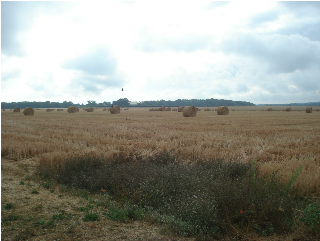
1 - Vue du terrain dans son état actuel depuis l'avenue du Parc Alata à l'Ouest de la parcelle, en direction de l'Est.

Nota: Repérage des points de vue des prises photographiques indiqué au plan PC1 - Plan de situation